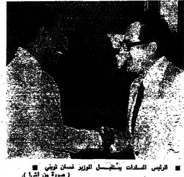
الرئيس السادة يستقبل الوزير عثمان تويني

تحدث الوزير عثمان تويني أمس عن زيارته للقاهرة ومناقشته للرئيس السادة في مؤتمر صحفي عقده في مكتبه بوزارة السيادة. ونقل الوزير تويني عن الرئيس السادة قوله ان اتفاق الفصل الجديد في سيناء هو خطوة على طريق مؤتمر جنيف الذي سيحدث قريبا. وقال الوزير تويني: كانت مقابلي مع الرئيس السادة مهمة جدا. وتمكنت خلالها من الاتفاق على اتفاق، طبعاً ليس بنهضة الحربي، ولكن بخطوة العرضية وأطارة السياسي. ومضى يقول: الذي يوصي بتكديده ان هذا الاتفاق هو جزء من كسل، وضمن سياسة فك الارتباط التي تهدف بشكل عام لتحرير الارض العربية تدريجياً. بالطبع هناك كلام يتل من بوند سرية في الاتفاق، وقد أكد لي الرئيس السادة ان ليس هناك اي بندق سري في الاتفاق مع سيناء. ويعرض على مجلس الشعب، وأهم شرط في هذا الاتفاق هو مغفارة